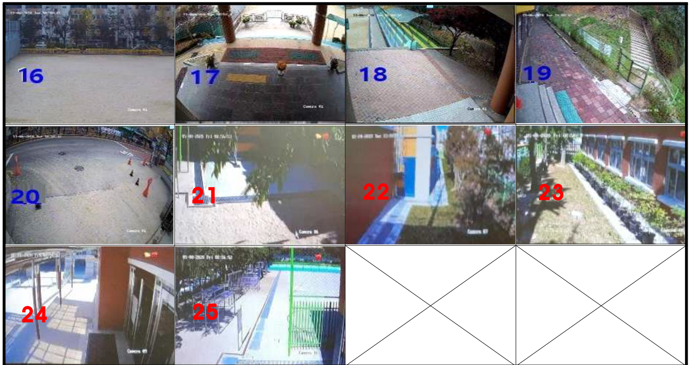
<당직실 2번 모니터[위]>